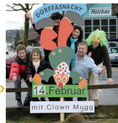
Das gemischte Komitee 2009.

Wir «Die Partyhelden» durften im 2018 das erste mal bei Euch aufspielen.