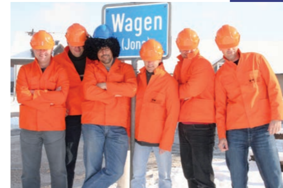
Die damaligen «Putsch»-Aktivisten 2006 gaben sich etwas bedeckt.